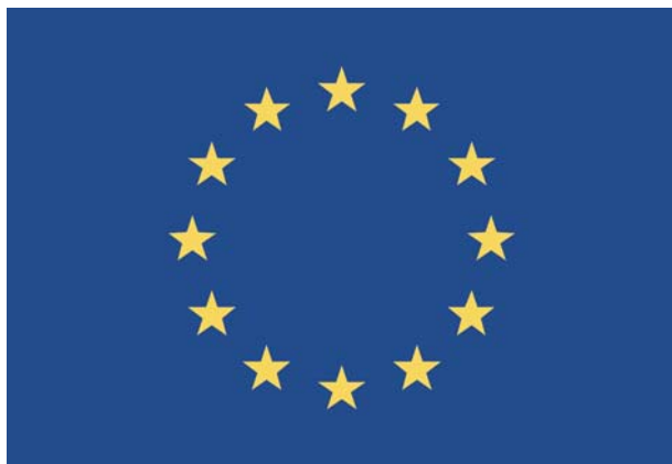
Simbolul Uniunii Europene, color

Se recomandă plasarea siglei pe un fundal alb. Dacă totuși se folosește un fundal multicolor, sigla va avea un contur alb cu grosimea egală cu 1/25 din înălțimea dreptunghiului.