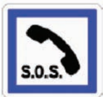
Telefon pentru apeluri de urgență

Nișele de serviciu sunt semnalizate cu ajutorul indicatoarelor de informare, care sunt indicatoare F, în conformitate cu Convenția de la Viena, și indică echipamentele disponibile pentru utilizatorii drumurilor, cum ar fi: