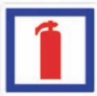
Stingător de incendiu

Produs electronic destinat exclusiv informării gratuite a persoanelor fizice asupra actelor ce se publică în Monitorul Oficial al României