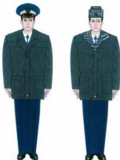
3.3. Modelul uniformei de iarnă pentru comisarii Gărzii Financiare: scurtă din piele cu mesadă și guler detașabile, căciulă din nutriet sau astrahan