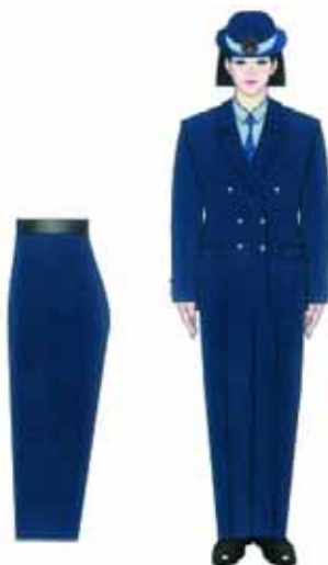
3.2.2. Modelul uniformei pentru comisarii Gărzii Financiare — femei: varianta cu pantalon