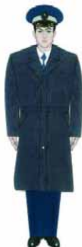
3.4. Modelul uniformei pentru comisarii Gărzii Financiare: Manta din piele naturală