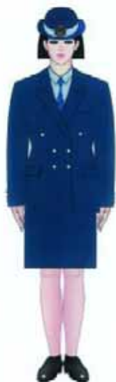
3.2.1. Modelul uniformei pentru comisarii Gărzii Financiare — femei: varianta cu fustă