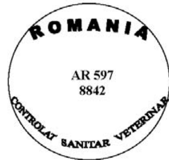
Figura nr. 2

Modelul mărcii de sănătate pentru carnea proaspătă de porc provenită de la porci vaccinați, obținută în unități aprobate pentru comerț cu statele membre ale Uniunii Europene, utilizată numai pe teritoriul României