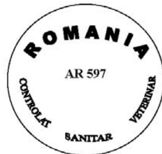
Figura nr. 4

Modelul mărcii de identificare pentru carnea tocată, carnea preparată și produse din carne obținute din carne de porc, produse în unități aprobate pentru comerț cu statele membre ale Uniunii Europene, utilizată numai pe teritoriul României