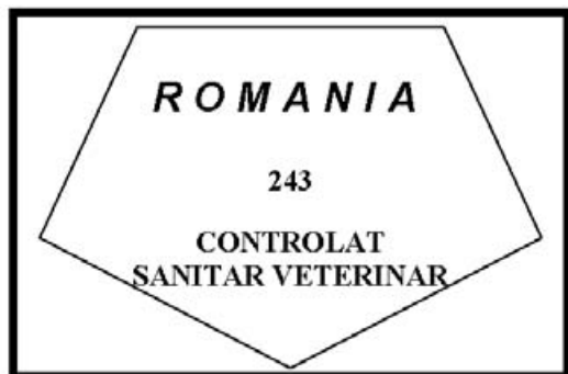
Figura nr. 5

3. Marca de sănătate pentru carnea proaspătă de porcine sălbatice obținută și comercializată pe teritoriul României