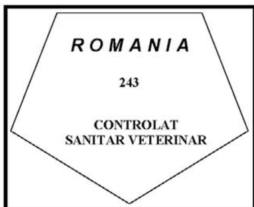
Figura nr. 7

4. Marca de identificare pentru carnea tocată, carnea preparată, produse din carne și produse care conțin carne de porcine sălbatice, obținute și comercializate pe teritoriul României