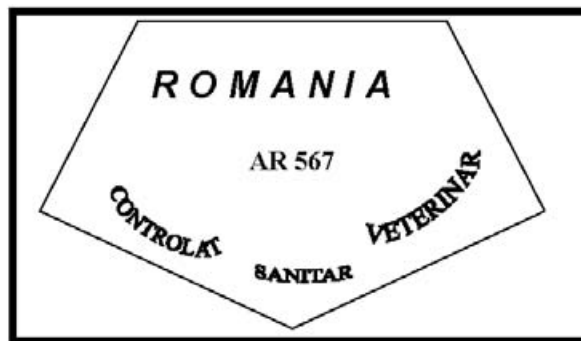
Figura nr. 6

Modelul mărcii de sănătate pentru carnea proaspătă de porcine sălbatice vaccinate, obținută în unități aprobate pentru comerț cu statele membre ale Uniunii Europene