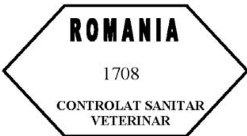
Figura nr. 3

2. Marca de identificare pentru carnea tocată de porc, carnea preparată de porc, produse din carne de porc și produse care conțin carne de porc obținute și comercializate pe teritoriul României