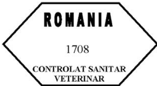
Figura nr. 1

1. Marca de sănătate pentru carnea proaspătă de porc obținută și comercializată pe teritoriul României