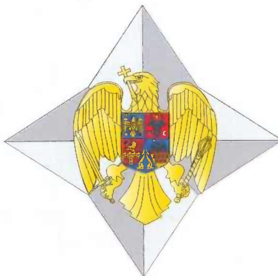
Placa gradului de Mare Ofițer