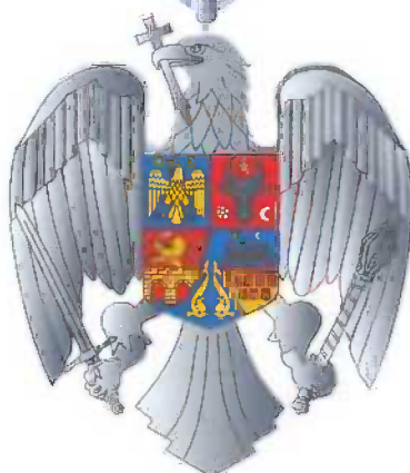
Gradul de Comandor Avers