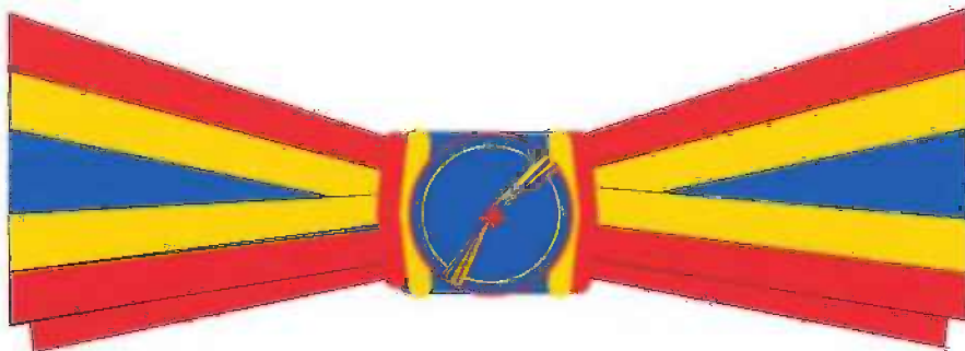
Funda pentru persoanele de sex feminin, gradul de Ofițer