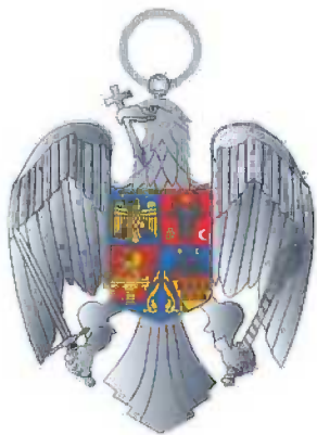
Gradul de Cavalier Avers