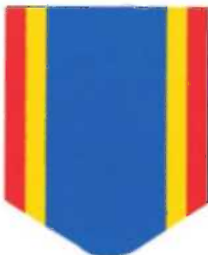
Panglica gradului de Cavalier