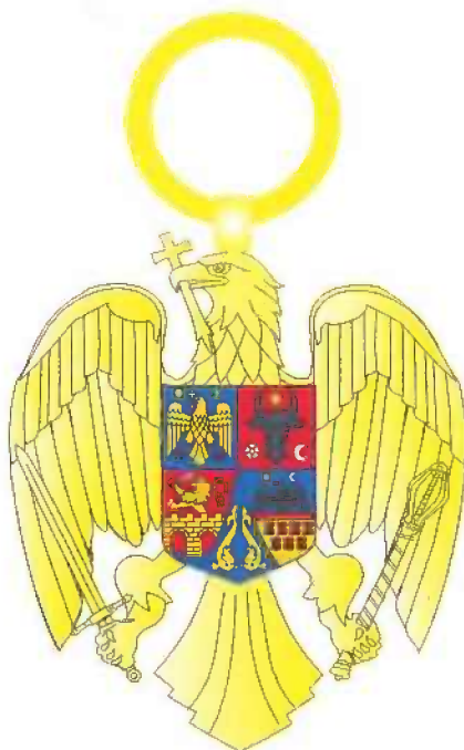
Însemnul gradului de Mare Cruce