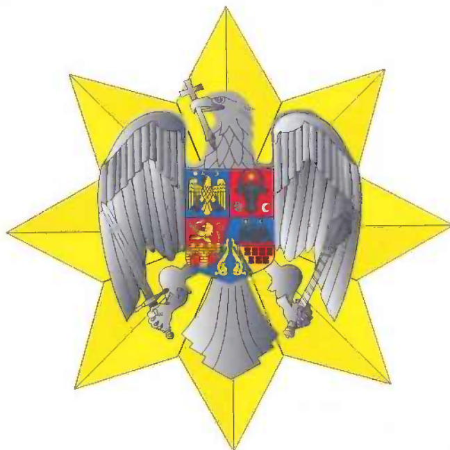
Placa gradului de Mare Cruce