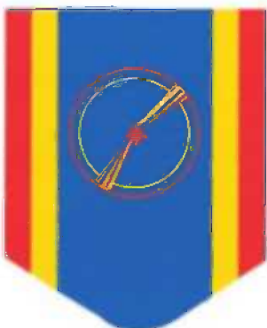
Panglica gradului de Ofițer