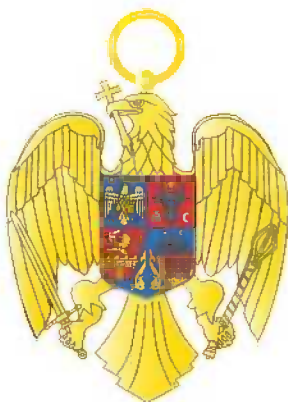
Gradul de Ofițer Avers