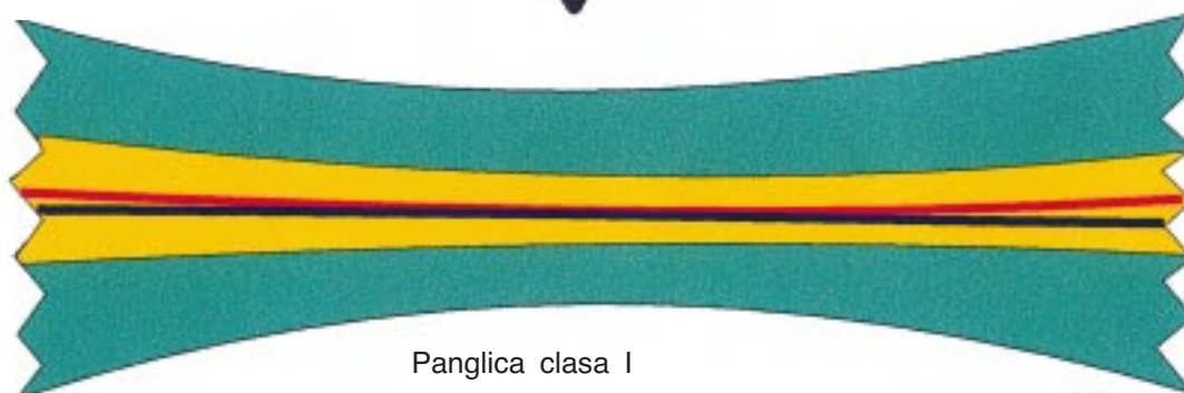
Panglica clasa I