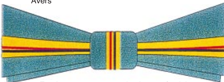
Funda pentru persoanele de sex feminin