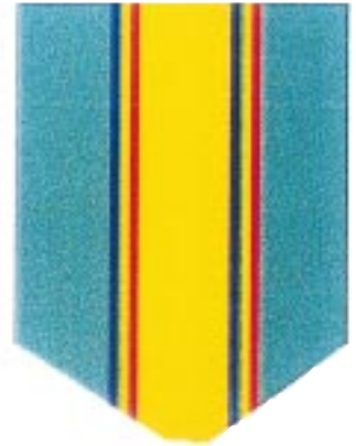
Rozeta clasa a III-a