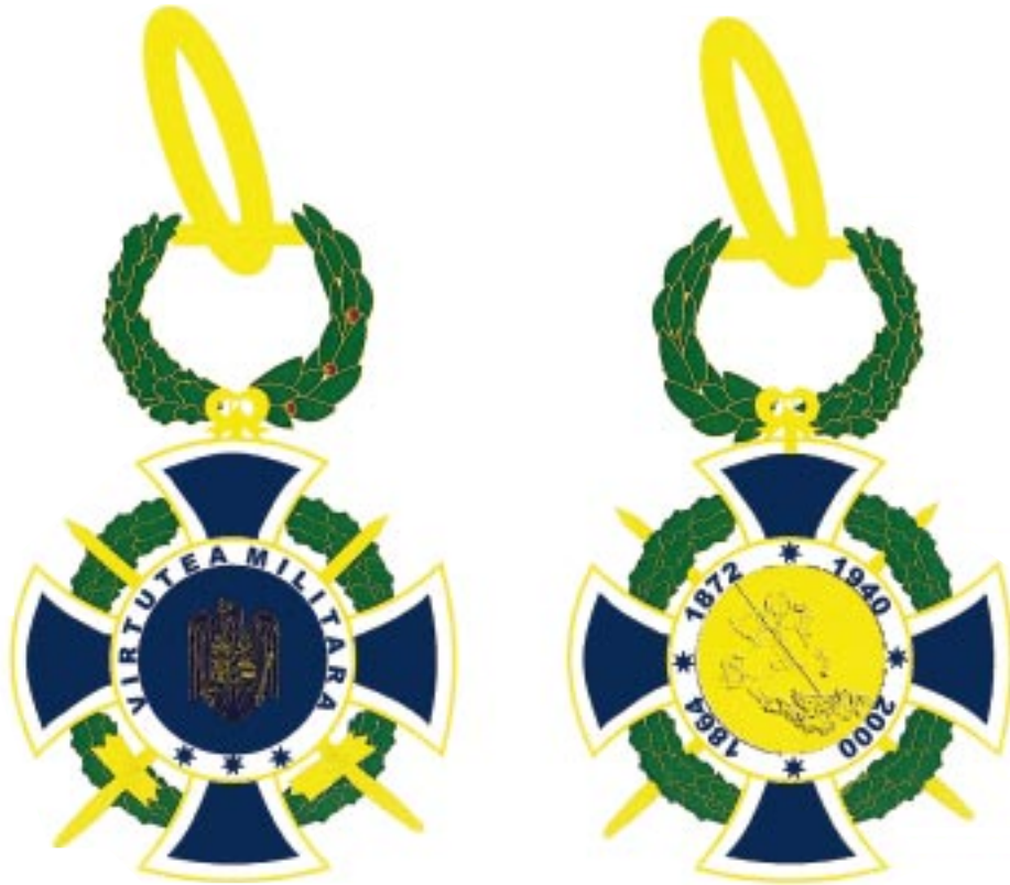
Avers — Revers