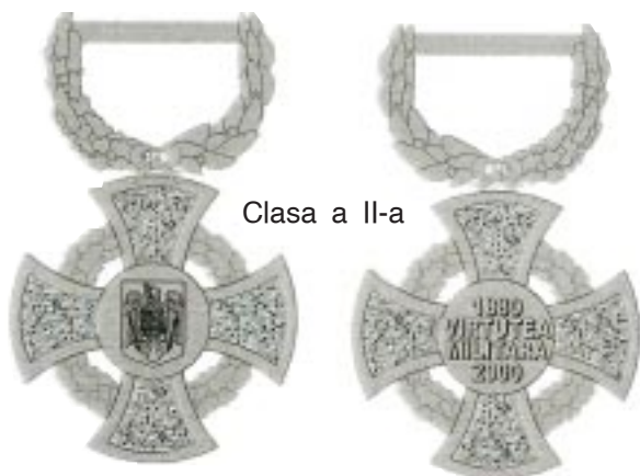
Clasa a II-a