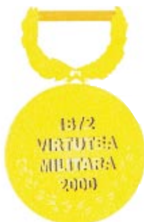
Avers — Revers