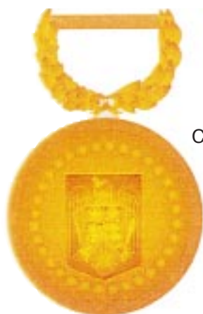
Clasa a III-a