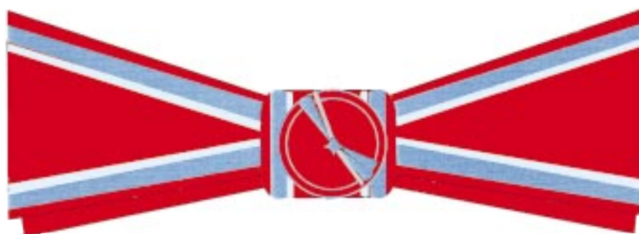
Fundă (papion) doamne Ofițer