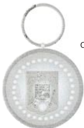
Clasa a II-a