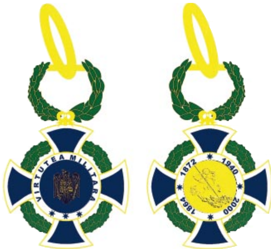
Avers — Revers