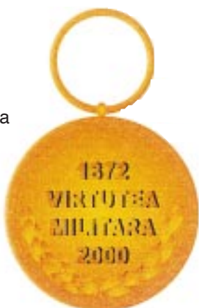
Avers — Revers