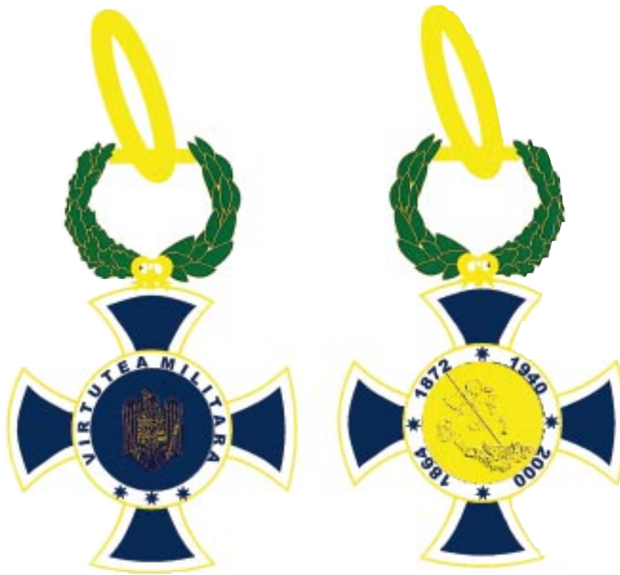
Avers — Revers