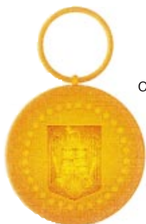
Clasa a III-a