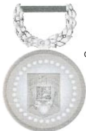
Clasa a II-a