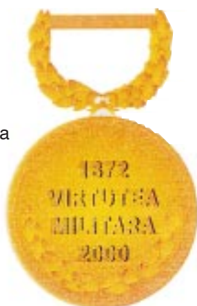
Avers — Revers