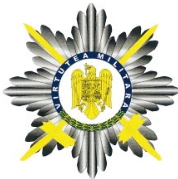
Bareta „de război“