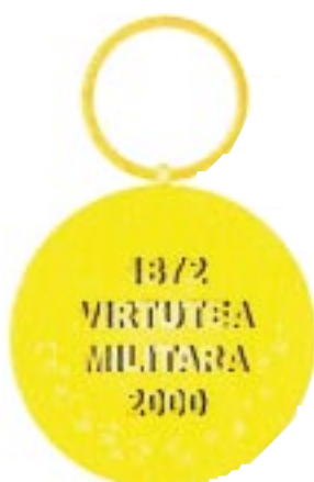
Avers — Revers