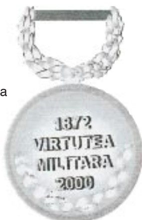
Avers — Revers