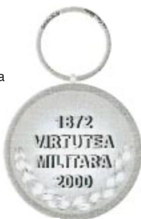
Avers — Revers