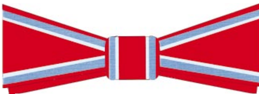
Fundă (papion) doamne Cavaler