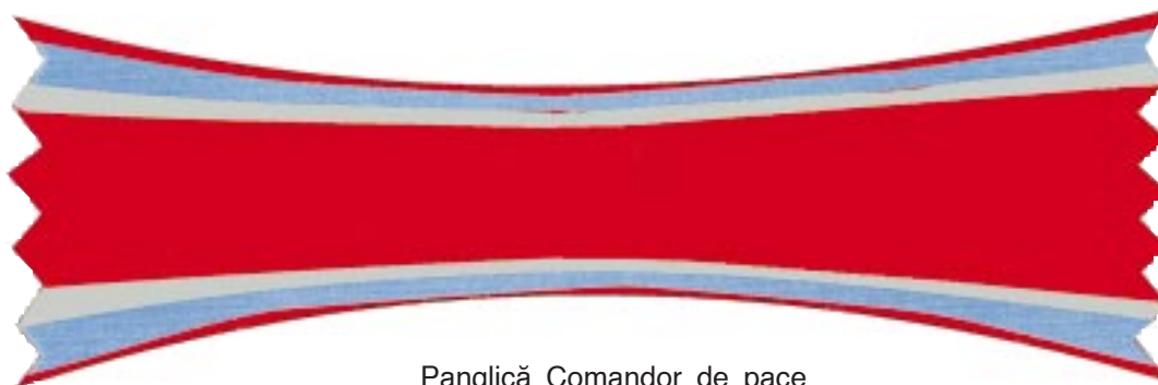
Panglică Comandor de pace