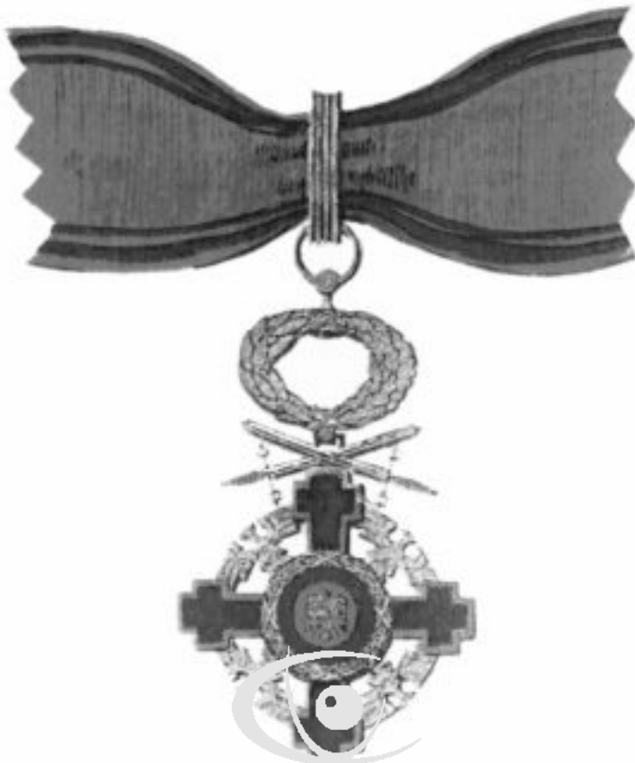
Steaua României — Comandor; pentru civili, fără săbii