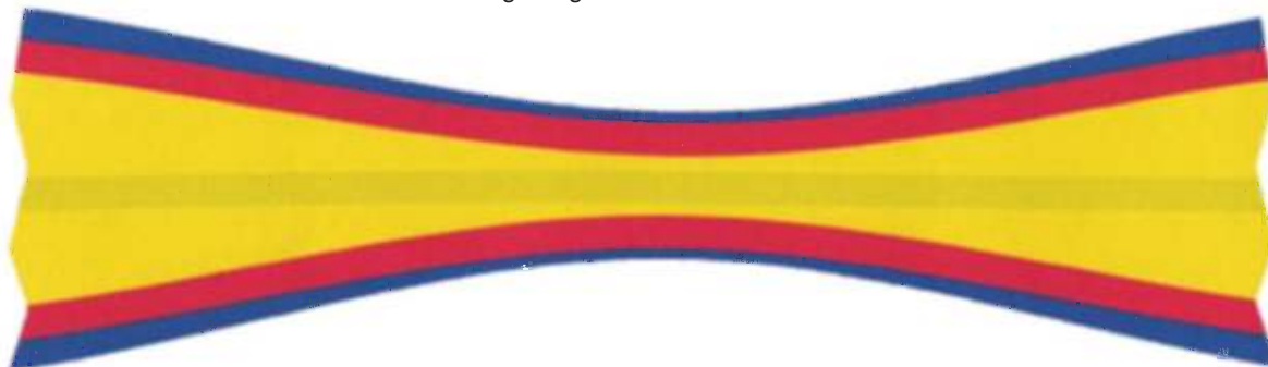
Panglica gradului de Comandor