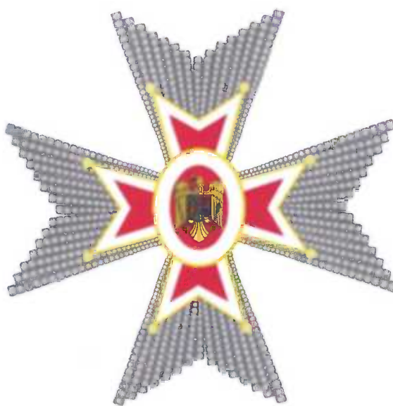
Placa gradului de Mare Ofițer