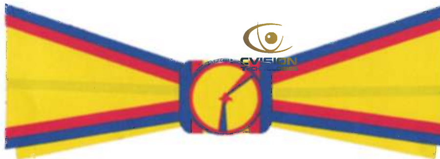
Funda pentru persoane civile de sex feminin gradul de Ofițer