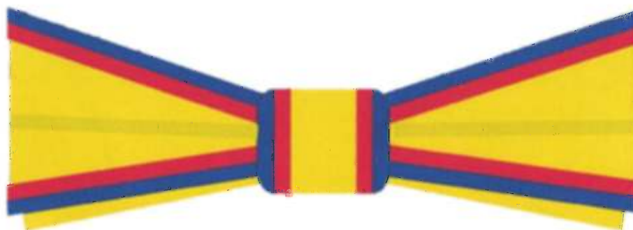
Funda pentru persoane civile de sex feminin gradul de Cavaler