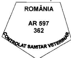
Figura nr. 5

Modelul ștampilei de sănătate pentru marcarea cărnii de vânat sălbatic, destinată utilizării în țară