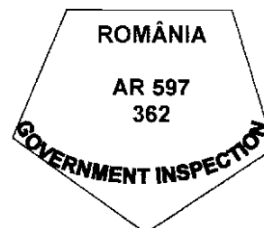
Figura nr. 7

Modelul ștampilei de sănătate pentru marcarea cărnii de vânat sălbatic, destinată exportului în alte state decât cele care sunt membre ale Uniunii Europene