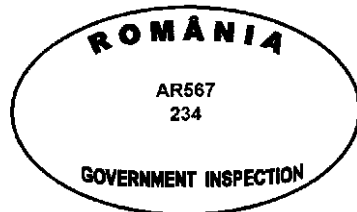
Figura nr. 4

Modelul ștampilei de sănătate pentru marcarea cărnii destinate exportului în alte state decât cele care sunt membre ale Uniunii Europene