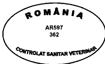
Figura nr. 2

Modelul ștampilei de sănătate pentru marcarea cărnii destinate utilizării în țară