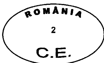
Figura nr. 3

Modelul ștampilei de sănătate pentru marcarea cărnii destinate exportului în statele membre ale Uniunii Europene